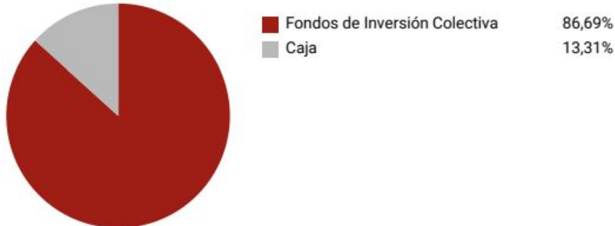
Composición del Portafolio por Sector Económico